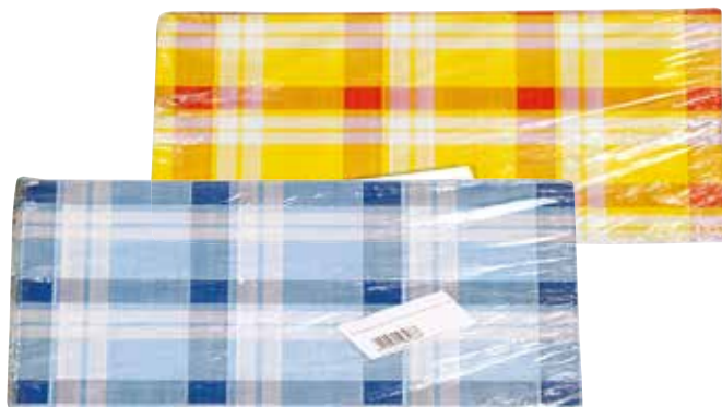
Tovaglia Duocolor 100x100 1 Velo pz 100