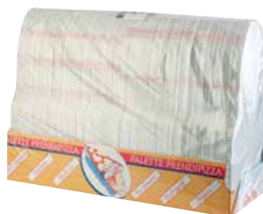
Palette Prendipizza pz 200