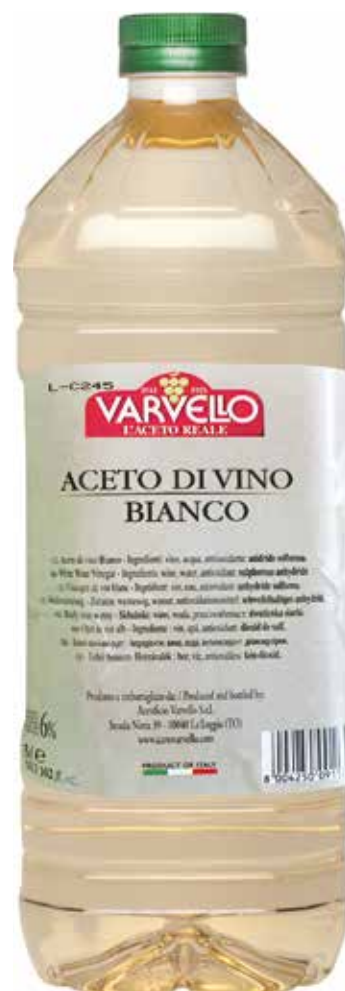
Aceto di Vino Bianco VARVELLO lt 3