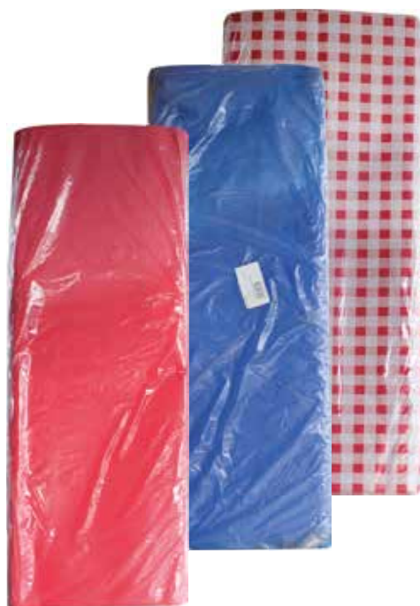
Tovaglia Tartan, Rossa, Blu 100x100 1 Velo pz 100