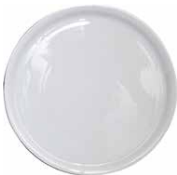
Piatto Pizza Bianco Nola Porcellana