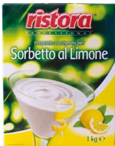
Preparato per Sorbetto al Limone RISTORA kg 1