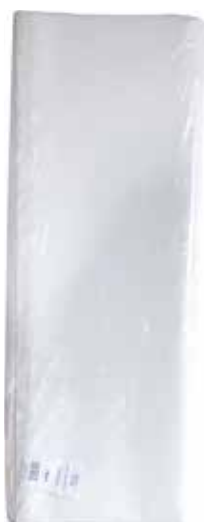
Tovaglia Bianca 100x100 1 Velo pz 100