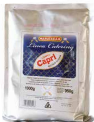
Tonno all'Olio di Oliva CAPRI kg 1